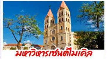
มหาวิหารเซนต์ไมเคิล