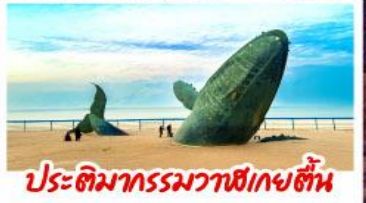
ประติมากรรมวาฬยักษ์ต้น