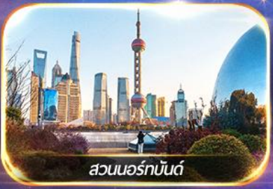
สวนนอร์กบัณฑิต