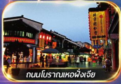
ถนนโบราณเหอผิงเจีย

เช็คอินมุมฮิตใน TIKTOK ณ หาดไว่ทาน เตอะบันด์ + หอไข่มุก อิสระช้อปปิ้งย่านดัง หรือ เลือกซื้อ OPTION SHANGHAI DISNEYLAND