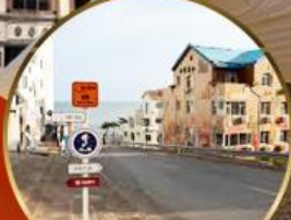
ถนนอ่าวจีป่า