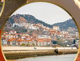
ซาจี้โข่ว