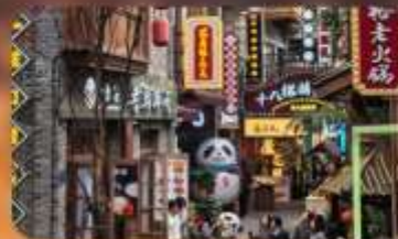
หมู่บ้านสีปาที