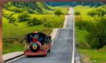
หุบเจานางฟ้า