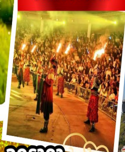
ปาร์ตี้รอบกองไฟ