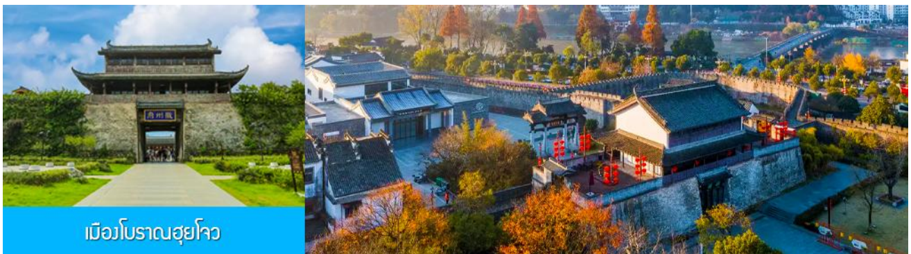
เมืองโบราณฮุยโจว

หลังอาหารนำท่านเที่ยวชม เมืองโบราณฮุยโจว 徽州古城 แหล่งท่องเที่ยวระดับ 5A และเป็นหนึ่งในสี่เมืองโบราณที่คงสภาพสมบูรณ์และมีขนาดใหญ่ที่สุดของจีน ตั้งอยู่ในอำเภอเซ่อเจี๋ยน มณฑลอันฮุย เมืองโบราณ