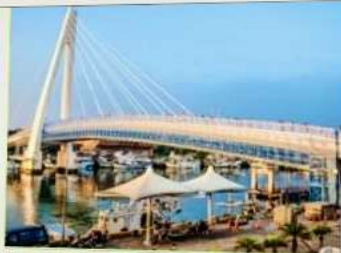
สะพานคู่รักตั้นสุ่ย