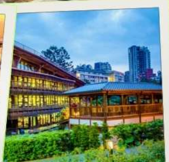
ห้องสมุดเป่ย์โถว