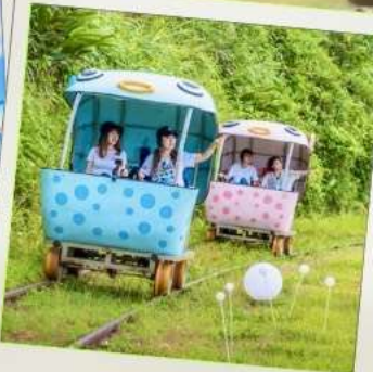
Shen'ao Rail Bike