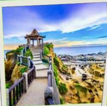
อุทยานเกาะเหอผิง