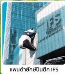
แพนด้ายักษ์ป็นดิ๊ก IFS