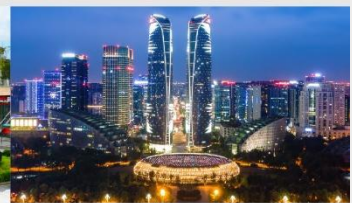
ตึกแฝดเจียงตู

*ทางบริษัทฯ ขอสงวนสิทธิ์ในการสลับโปรแกรมทัวร์ตามความเหมาะสมขึ้นอยู่กับสถานการณ์หน้างาน โดยคำนึงถึงผลประโยชน์ของลูกค้าเป็นสำคัญ