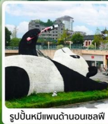
รูปปั้นหมีแพนด้าบนเขาสเซฟิ