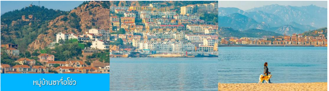
หมู่บ้านซาจื่อโข่ว

เช้า รับประทานอาหารเช้า ณ ห้องอาหารของโรงแรม (4)