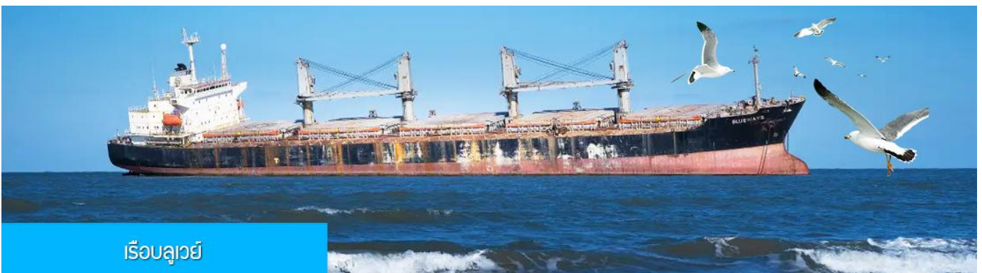
เรือบลูเวย์

เที่ยง รับประทานอาหารกลางวัน ณ ภัตตาคาร (5)