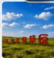
ทุ่งหญ้าออร์ดอส พิพิธภัณฑ์ชนชาวมองโกเลีย สวนตุ้มมองโกเลีย ป่าठीรอบกองไฟ