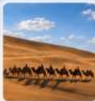
ทะเลทรายเสียดาฮาน (รวมกระเช้า+จีอู)