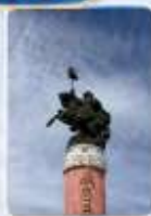
สวนสุสานเจงกิสข่าน (ชมด้านนอก)