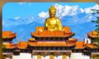
วัดพระใหญ่ทวงกงซาน