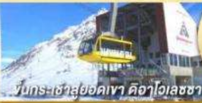
ขึ้นกระเช้าสู่ยอดเขา ดิอาไวเลซซา