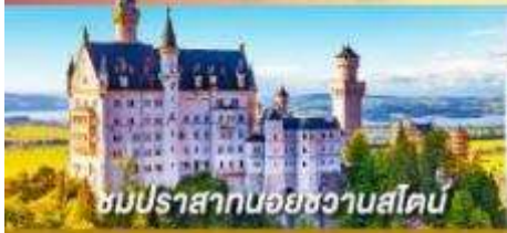
ชมปราสาทนอยชวานสไตน์