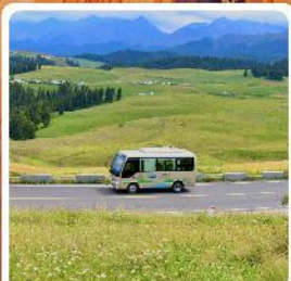
ทุ่งหญ้าเจียบจูลาเค่อ