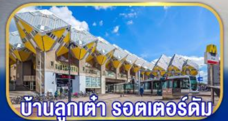
บ้านลูกเต่า รถเตอร์ดัม

เยือนเมืองเก่าแก่ยุโรป ทั่วมหาสมุทรแอตแลนติก กับการบินไทย บินตรงอัมสเตอร์ดัม