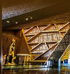
พิพิธภัณฑ์ไทรนดิวียบด์ (GEM)