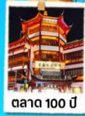
ตลาด 100 ปี