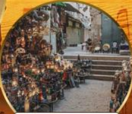
ตลาดบ้านเอลคาลิลี