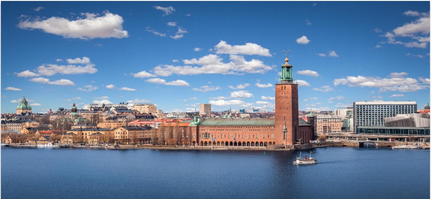
STOCKHOLM CITY HALL

จากนั้นนำทุกท่านชม ศาลาว่าการเมืองสต็อกโฮล์ม (Stockholm City Hall) ซึ่งเป็นสถานที่จัดงานเลี้ยงอันทรงเกียรติสำหรับผู้ได้รับรางวัลโนเบลที่มีชื่อเสียงไปทั่วโลก พิธีมอบรางวัลโนเบลจะจัดขึ้นในเดือนธันวาคมของทุกปี ตัวอาคารแห่งนี้สร้างขึ้นจากอิฐแดงกว่า 8 ล้านก้อน ใช้เวลาก่อสร้างยาวนานถึง 12 ปี แล้วเสร็จในปี ค.ศ. 1911 ภายในอาคารมีห้องโถงที่ตกแต่งอย่างงดงาม โดยเฉพาะ “ห้องต้นรำ” ที่ประดับผนังด้วยลวดลายหิน