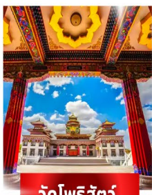
วัดไพรส์ัตว์