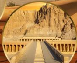
หุบเขาลักซอร์