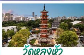
วัดเลงเซ้ง