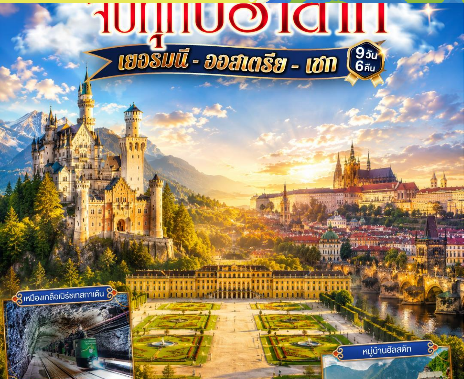
เหมืองเกลือบิรชเทสกาเดิน