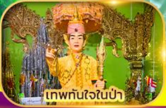
เทพทันใจในป่า