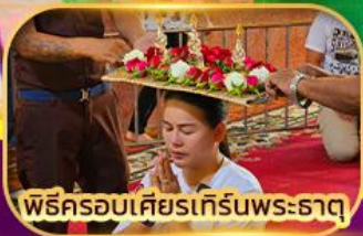
พิธีครอบเศียรเทรินพระธาตุ