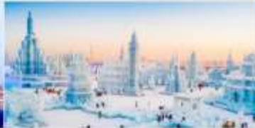
เทศกาลคอมไฟน้ำแข็ง