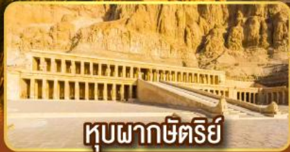
หุบผากษัตริย์