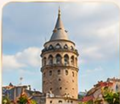
GALATA TOWER หอคอยกาลาตา