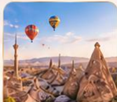
CAPPADOCIA คัปปาโดเกีย