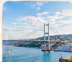
BOSPHORUS STRAIT ช่องแคบบอสฟอรัส