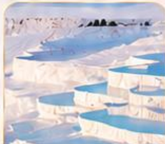
PAMUKKALE ปานุกคาล่า