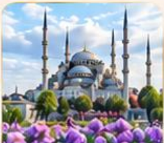
BLUE MOSQUE สุเหร่าสีน้ำเงิน