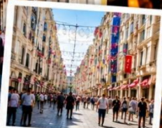
ISTIKLAL STREET (Grand Avenue of Pera) ถนนสายช้อปปิ้ง ยิม ฮีล ครองใจทั้งใจ