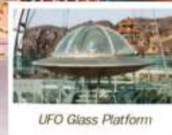
UFO Glass Platform