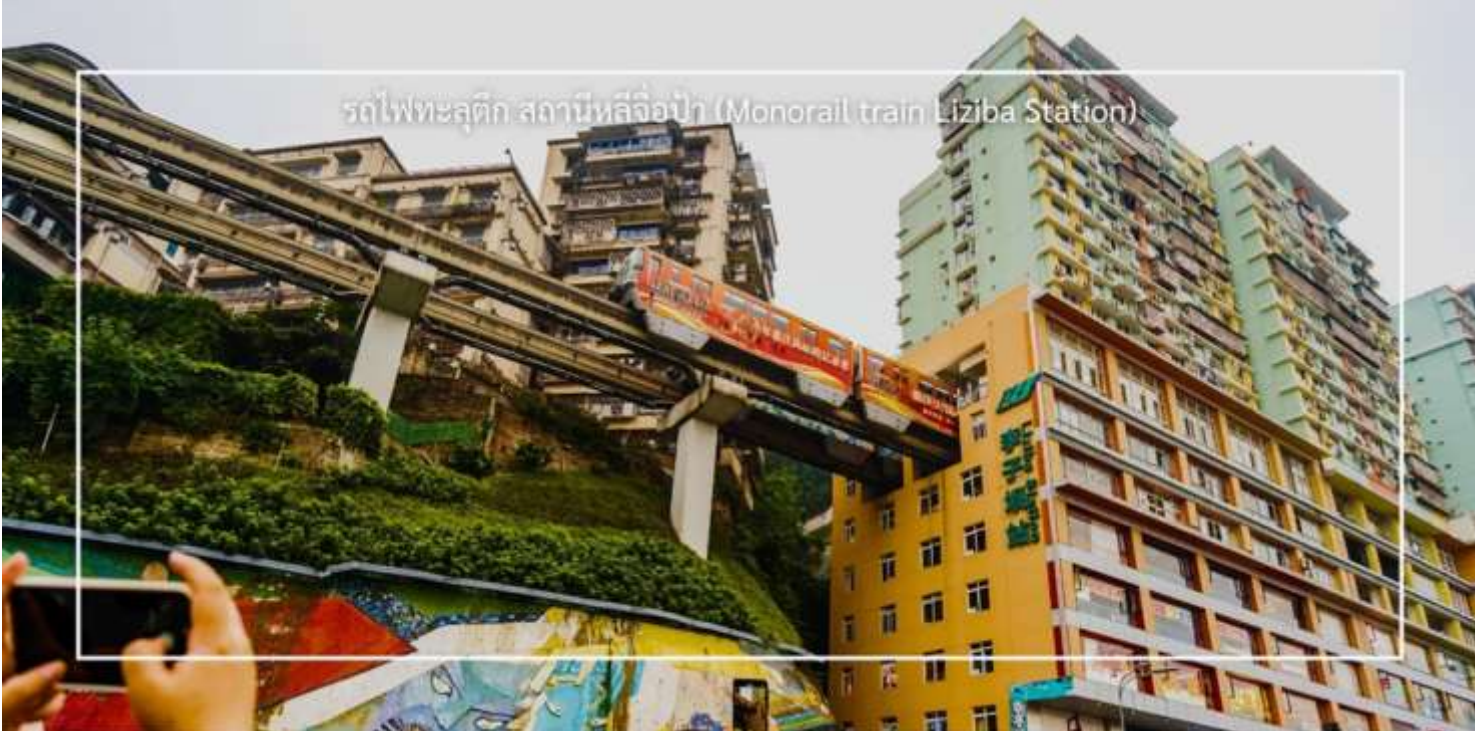
รถไฟฟ้าลัดราง สถานีลิซ่า (Monorail train Liziba Station)