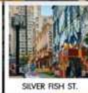
SILVER FISH ST.