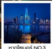
หาดไซเบอร์ NO.3

ทัวร์คุณธรรม ไม่หลงร้านช้อปปิ้ง ไม่ขายออฟชั่น