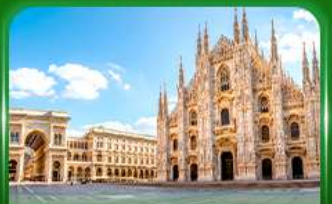
มหาวิหารดูโอโมแห่งมิลาน