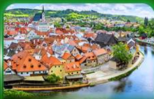
เมืองมรดกโลก เซสกีครมุลพ