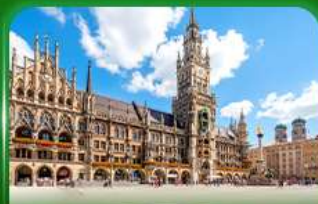
จัตุรัสมาเรียนพลัทซ์ มิวนิก