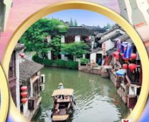
หมู่บ้านโบราณจูเจียเจี้ยว ล่องเรือแจว