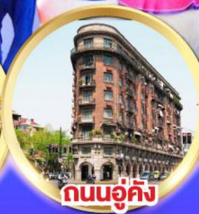
ถนนอู่คัง