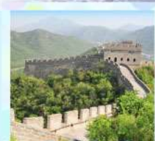
ตลาดร้อยปีเจิ้งหวิงเมี่ยว กำแพงเมืองจีน ด้านจวิยงกวน