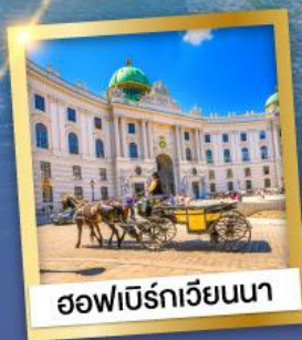
ออฟเบิร์กเวียนนา

เข้าชมความงดงามภายใน ของปราสาทนอยชวานสไตน์