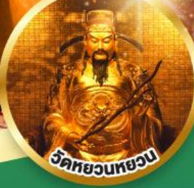
วัดทวยนทวยน ขอพรเรื่องสุขภาพ, โชคลาภ ความเจริญก้าวหน้า

เมนูพิเศษ! ต้มช่าฮ่องกง, บุฟเฟ่ต์ชาบูสไตล์ฮ่องกง, ห่านย่าง