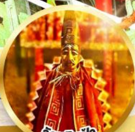
วัดหินฟ้า ขอพรเสริมโชคกลางในธุรกิจ และการเงิน