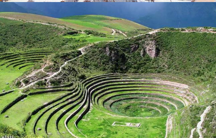
บ่าย นำท่านเดินทางสู่ มาราซ (Maras) แหล่งผลิตเกลือที่คุณภาพดีที่สุดในโลก ที่มีมาตั้งแต่สมัยอินคา แนวนาขั้นบันไดที่เรียงอยู่ตามลำดับความสูงของภูเขา จากนั้นเดินทางสู่ โมเรย์ (Moray) นาขั้นบันไดวงกลมขนาดใหญ่หลายๆรูปร่างแปลกตาที่ชาวอินคาทำไว้เพื่อทดลองปลูกพืชพันธุ์ต่างๆ จากจุดนี้สามารถมองเห็น หมู่บ้านอูรัมบัмба (Urubamba) ได้อีกด้วย ได้เวลาเดินทางกลับสู่เมือง เมืองคัสโก (Cusco) เมืองหลวงของอาณาจักรอินคา ที่แพร่ขยายอำนาจจนกินพื้นที่ 1 ใน 3 ของอเมริกาใต้ ตั้งอยู่เหนือระดับน้ำทะเลถึง 3,400 เมตร และเป็นแหล่งอารยธรรมยุคก่อนประวัติศาสตร์ที่ลึกลับน่าทึ่ง เป็นชุมชนเก่าแก่ของจักรวรรดิอินคาอันรุ่งเรือง ซึ่งยังคงทิ้งร่องรอยความเจริญไว้ให้เห็นเป็นซากปรักหักพังโบราณและโบราณวัตถุต่างๆ