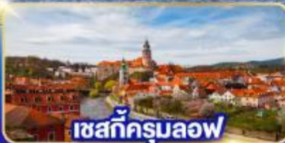
เซสกีครุมลอฟ