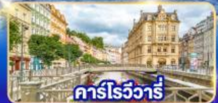
คาร์โรวัวร์