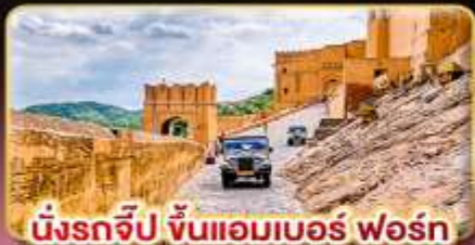
มังกรจีป ขึ้นแอมเบอร์ ฟোর্น