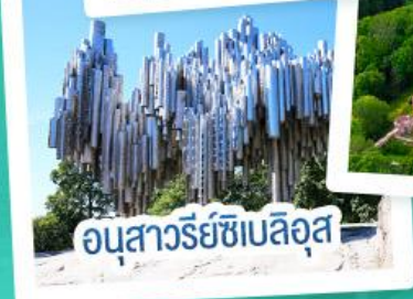
อนุสาวรีย์ซิมสึอูส